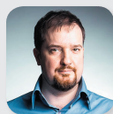
Дизайн и верстка Погорельский Андрей

Адрес редакции: 191119, Санкт-Петербург, улица Достоевского, д. 40-44, лит. А. Учредитель: Частное образовательное учреждение дополнительного профессионального образования «Высшая школа медицины «Эко-безопасность»